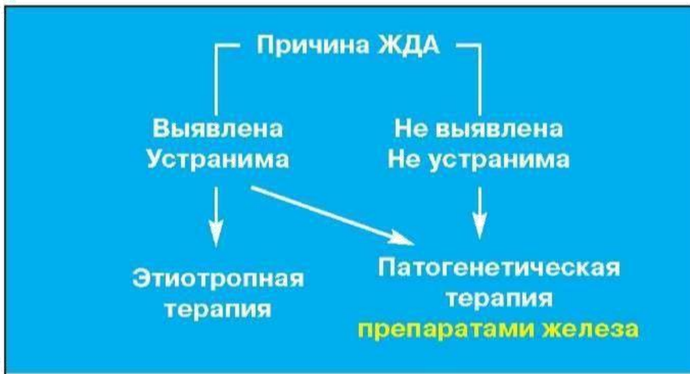
Рис. 1. Стратегия ведения больных при выявлении ЖДА

Оптимальная последовательность диагностического поиска заключается именно в выполнении всех диагностических процедур, поскольку игнорирование необходимости второго «нозологического» этапа диагностического поиска может приводить к невыявлению потенциально курабельных заболеваний и неэффективности патогенетической терапии ЖДА.